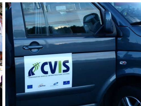
デモンストレーション