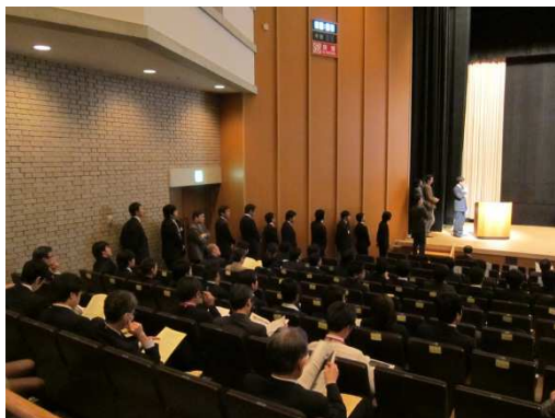
ショットガンの順番を待つ発表者

質的には例年通り様々だが、中には斬新な視点からの取り組みが高く評価されたものもあった(ベストポスター賞を受賞)。30秒という限られた時間内での発表やポスターの説明においては、事前に練習を行ってくるのか、極端な時間超過も無く、慣れを感じた。