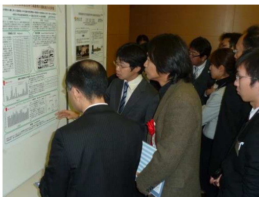
1分間で研究成果を説明、続いてQ&A

公開討議では類似のテーマを取り上げた研究者による議論を喚起するなど、モデレーターの手慣れた運営が活気のある場を生んでいた。