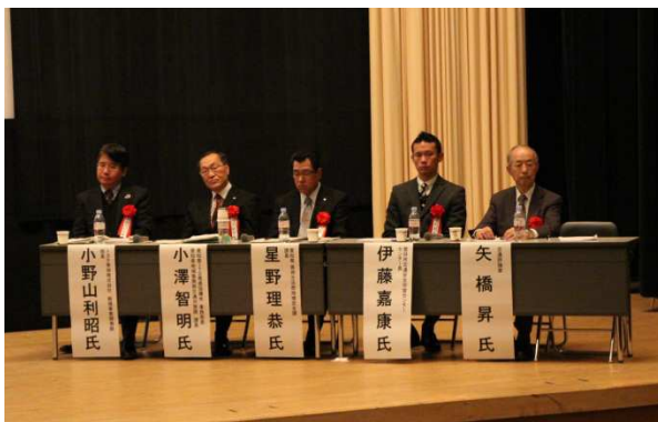
企画セッション2-1のパネリストの皆さん

毎回企画セッションの一つを公開セッション(無料)とするとともに、今回は愛知県立大学の授業の一環として認められたことからか、100名強の学生も聴講した。