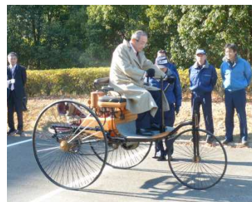
ガソリン自動車第1号試走