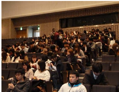
学生中心の一般聴講者